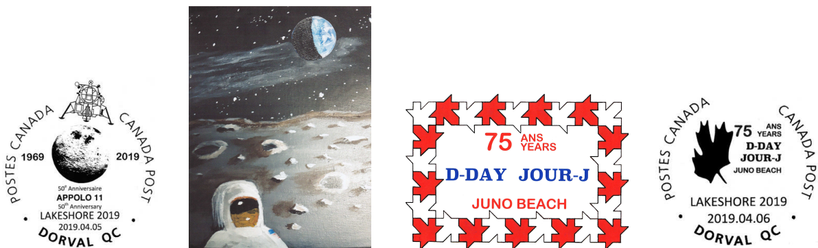
Illustrations des plis souvenirs et des oblitérations commémoratives.

Ce jour-là, les troupes alliées constituées de 150,000 soldats Américains, Canadiens, Britanniques et Français participèrent à l'invasion de la Normandie. Arrivant sur les péniches de débarquement les soldats prirent d'assaut les plages de Normandie pour attaquer et finalement vaincre les troupes d'occupation allemandes. Les troupes canadiennes ont débarqué à Juno Beach, tandis que les autres troupes débarquèrent sur les plages Utah, Omaha, Gold et Sword.